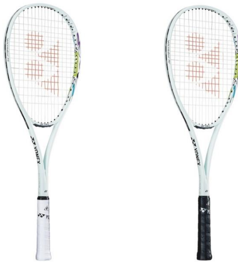
左から「VOLTRAGE 7S STEER」「VOLTRAGE 7V STEER」

ヨネックス株式会社（代表取締役社長：アリサ ヨネヤマ）は、“ヨネックス史上最速のスピードボール”と“大きく爽快な打球音”をコンセプトとしたソフトテニスラケット「VOLTRAGE (ボルトレイジ)」シリーズから、中学生を主体とした中級者向け軽量モデルとして、後衛向けの「VOLTRAGE 7S STEER (ステア)」、前衛向けの「VOLTRAGE 7V STEER」を2023年8月中旬より発売いたします。