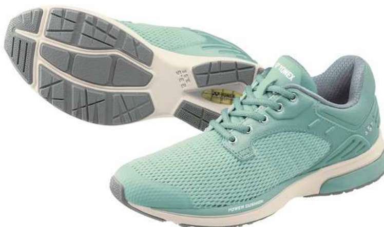
「パワークッション116」(ミント)

ヨネックス株式会社(代表取締役社長:アリサ ヨネヤマ)は、優れた衝撃吸収性、反発性を併せ持つ「パワークッション®プラス」を搭載し、心地よいフィット性とホールド性を追求した男女兼用のウォーキングシューズ「パワークッション116」を2022年5月上旬より発売いたします。