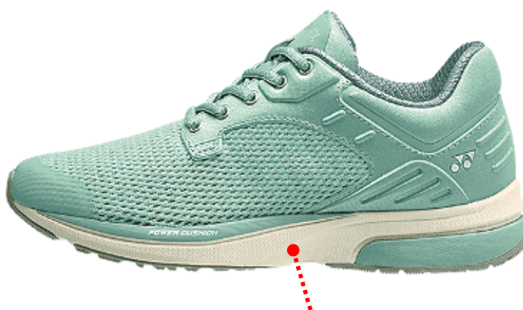
フェザーライトエックス

ミッドソール全体には、羽のように軽い新素材「フェザーライト エックス」を弊社ウォーキングシューズに初めて搭載。従来の弊社軽量素材ハイパーフェザーライトからも約12% * の軽量化を実現。