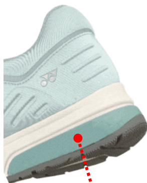
タフブリッドライト

最初に地面に接するかかと外側には、高い弾力性と形状維持性を持つ素材「タフブリッドライト」を採用することで、つま先までの体重移動の始まりをしっかりサポート。底面には各所に最適なラバーを配置し、優れた耐久性と安定性を実現しました。