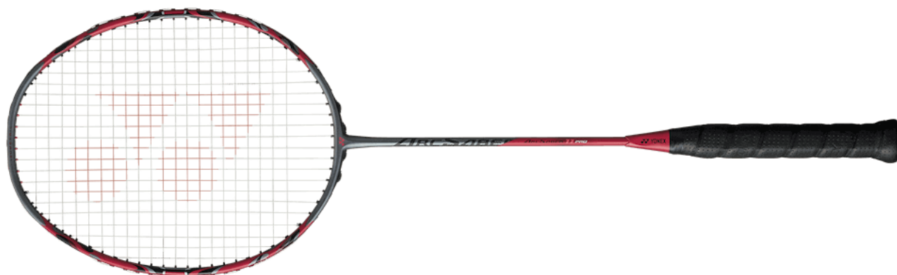
ARCSABER 11 PRO [グレイッシュパール]