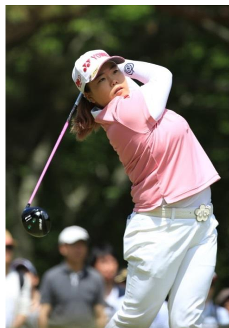
▲アンソングジュプロが使用