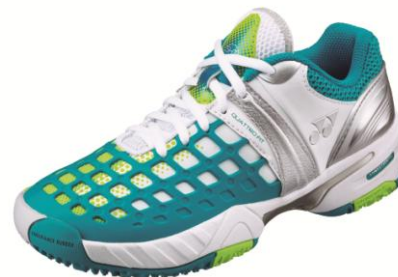
(女性用) エメラルド