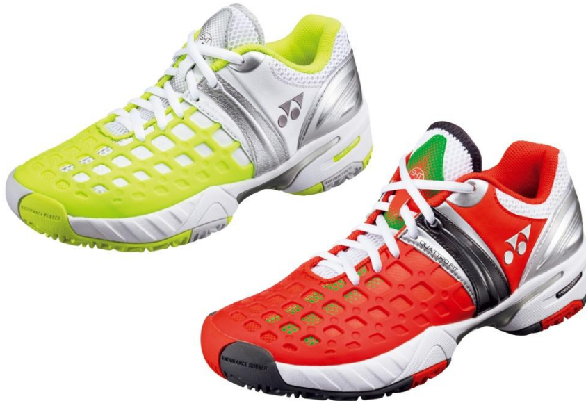
(左)パワークッション 27 レディース、(右)パワークッション 27 メン

ヨネックス株式会社(本社：東京都文京区、代表取締役社長：米山勉)は、激しい動きからのスムーズな着地と素早い切り返しを可能にし、足への負担を軽減するテニスシューズ「パワークッション 27 メン/レディース、パワークッション 17 メン/レディース」を2014年1月下旬に発売いたします。