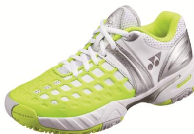
(女性用) レモンイエロー