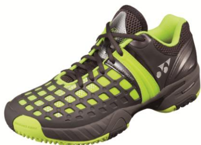
(男性用) シャインイエロー、