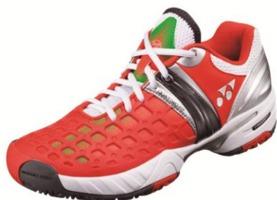
(男性用) スカーレット