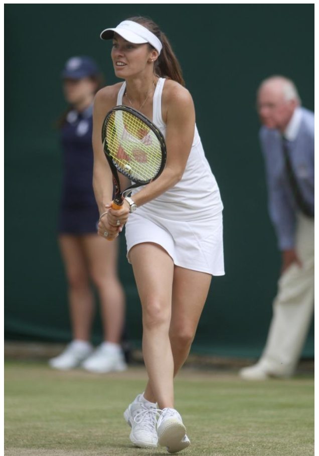
※写真は2013ウィンブルドンのものです。

しかしこの度、南カリフォルニア・オープンからツアー復帰することを決心。現在、全米各地で行われるプロテニスリーグのWTT(ワールドチームテニス)に参加しているヒンギス選手はシングル、ダブルス、ミックスダブルスを含め連戦連勝と絶好調。使用する弊社のラケットEZONE Xiについて、「パワーのあるスピードボールが打て、これまでのヨネックスラケットの中でも最高。」と絶賛しています。