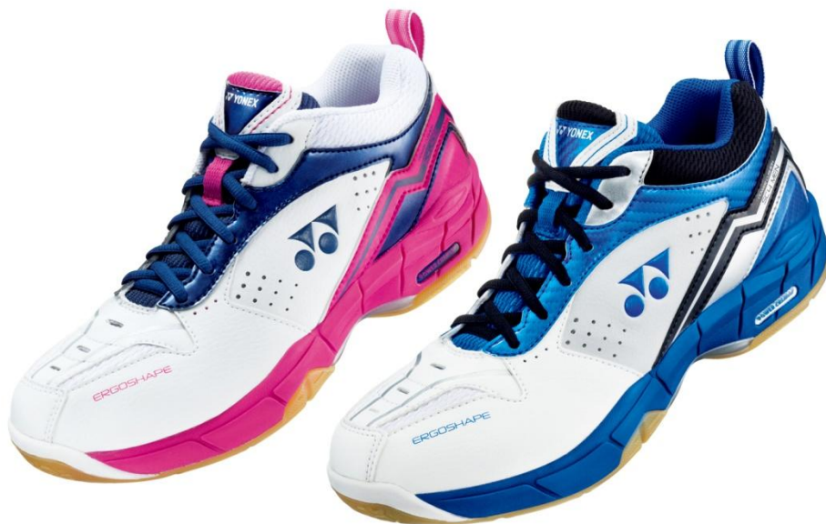
(右)パワークッション SC4 メン ブルー/ブラック