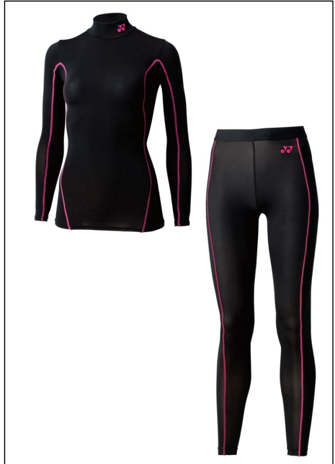
マッスルパワーSTB フィットネスモデル レディースハイネック長袖シャツ（左）と レディースロングスパッツ（右）

マッスルパワーSTBは、3段階の着圧によりコアバランスを整え、パフォーマンスの向上を促すアンダーウェアとして、主にアスリート層よりご好評をいただいておりますが、本商品はスポーツに親しむ愛好者がよりスポーツを快適に楽しむための“入門ギア”として開発。全体的な着圧で筋肉をサポートする適度なホールド感を持った着心地と、4,000円から5,500円（本体価格）の手頃な価格設定としたことにより、高機能アンダーウェアを着用したことのないお客様や、興味はあっても着用をためられるお客様に対して、機能面・価格面でご購入しやすいアンダーウェアとしました。