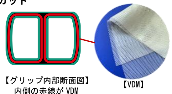
【グリップ内部断面図】 内側の赤線がVDM