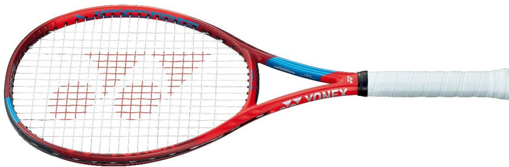
新 VCORE 98

ヨネックス株式会社（代表取締役社長：林田草樹）は、さらに進化した新次元カーボン「2G-Namd Flex Force（ツージーエヌアムドフレックスフォース）」※ 1 による強靱なしなりと復元で、スピン性能が向上したテニスラケット新「VCORE（Vコア）シリーズ」を2021年1月下旬より世界同時発売いたします。