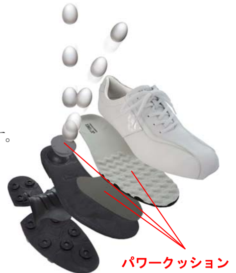
パワークッション