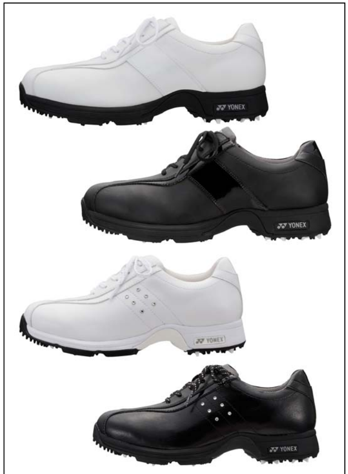
上からメンズモデルのホワイト、ブラック、レディースモデルのホワイト、ブラック

カラーバリエーションは、メンズ・レディースモデルともに、どのゴルフウェアにも合わせやすいホワイトとブラックの2色展開としています。