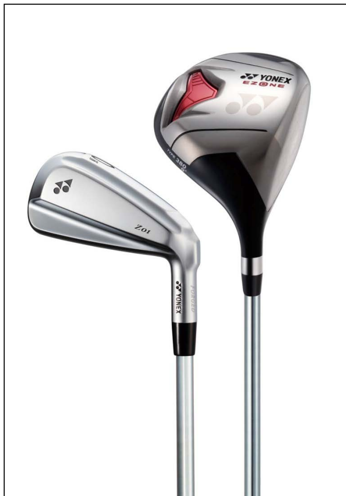
▲「ナノプリームシャフト」装着 EZONE タイプ 380 ドライバー(写真右)とゼロアイアン(写真左)

ノプリーム」は、シャフトのカーボン繊維とエポキシ樹脂の結合力を高めることで、高い強度と大きなしなり特性を両立させています。これを最も変形の大きいキックポイント付近から先端にかけて複合したことで、強靱なしなりと高い反発性が生まれ、大きな飛びが可能になります。