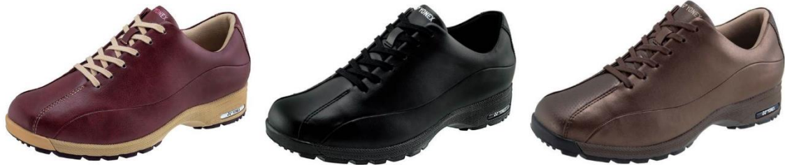
女性用「L21N」左からワインレッド、ブラック、ブロンズ