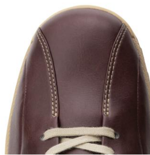
【ゆったりとしたつま先設計】