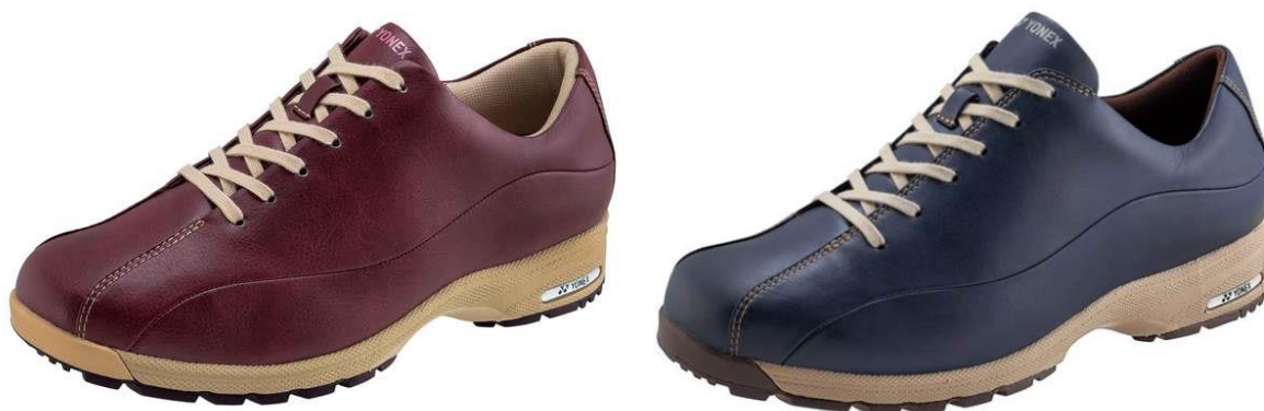
左から、女性用「L21N」ワインレッド、男性用「M21N」ネイビーブルー

ヨネックス株式会社（代表取締役社長：林田 草樹）は、ウォーキングシューズの最大の機能である衝撃吸収性と反発力を併せ持つ素材「パワークッション。プラス」を搭載し、ロングセラーモデル・LC/MC21をさらに進化させた「L21N」（女性用）「M21N」（男性用）を2020年9月中旬より発売いたします。