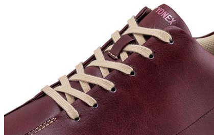
【紐の調整範囲が拡大】

つま先方向に紐穴を増やして紐の調整範囲を約 20%拡大させることで、足の甲のフィット感が高まり、安定性が向上。一方、つま先は余裕のあるゆったりとした設計を前モデルから引き継ぎ、フィット感と快適な履き心地を両立します。