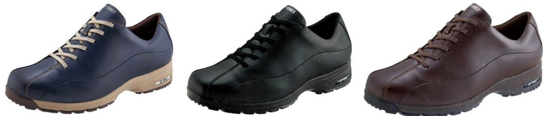
男性用「M21N」左からネイビーブルー、ブラック、ダークブラウン