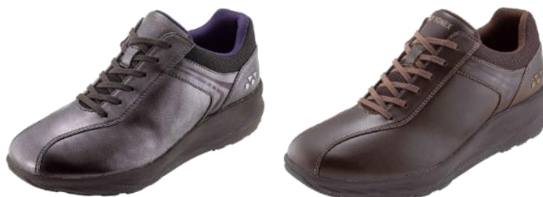
左から、女性用「LC103」パールチャコール、男性用「MC103」ダークブラウン