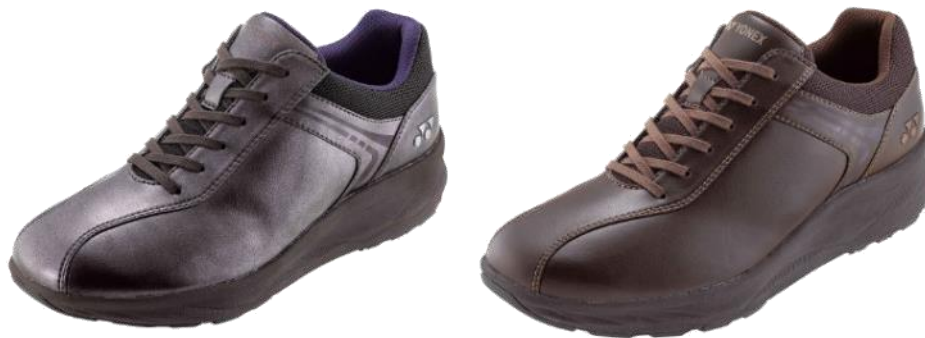
左から、女性用「LC103」パールチャコール、男性用「MC103」ダークブラウン

ヨネックス株式会社（代表取締役社長：林田 草樹）は、ウォーキングシューズ「LC103」「MC103」の新色・パールチャコール（LC103）、ダークブラウン（MC103）を2020年8月中旬より発売いたします。