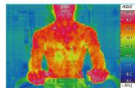
ポリエステル100%着用