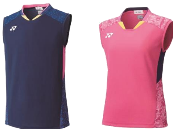
左から、メンズ ゲームシャツ(ミッドナイト)、ウィメンズ ゲームシャツ(ジュエルピンク)