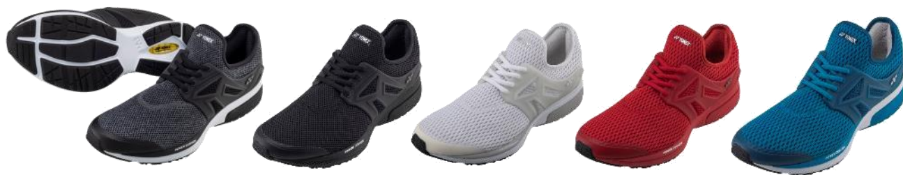
「パワークッション111」左からグレー、ブラック、ホワイト、レッド、マリンプルー