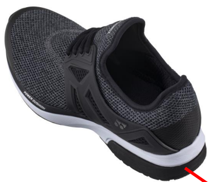
タフブリッドライト

ウォーキングで特徴的なかかと着地を考慮し、かかと部から外側の側面にかけて、硬さと弾力性を併せ持ち、すり減りにくく、へたりにくい「タフブリッドライト」、その下のソールには負荷がかかりやすいかかとをカバーする「超耐摩耗ラバー」を配置。着地時の衝撃を受けやすい、かかと部の耐久性を高めるとともに、安定性を確保しました。