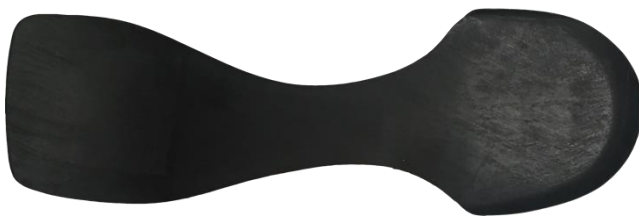
【3D パワーカーボン全体図：上面】

ミッドソールに内蔵した「3D パワーカーボン」は、かかと部の周囲を立ち上げることで根本から支え、着地時の横ブレを軽減し、安定させます。さらに、最適な繊維方向でカーボンを積層し、柔軟性と安定性を両立。適度なしなりが筋肉への負担を軽減し、前方への推進力を生み出します。