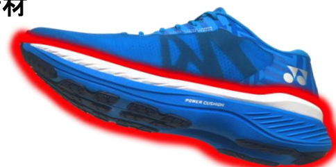
【フェザーバウンスフォーム搭載箇所】