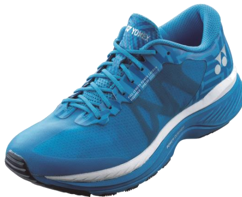
「セーフラン100M」(コバルトブルー)

12mの高さから落とした生卵が、割れずに6m以上跳ね返る「パワークッション®プラス」搭載 ストライドが伸びる新設計「3D パワーカーボン」を全面に搭載 ランナーの疲労を軽減し快適なランニングを実現する セーフラン100M(男性用)・100L(女性用)2019年9月下旬より発売