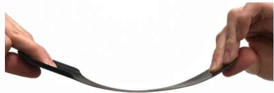
【しなりのイメージ】