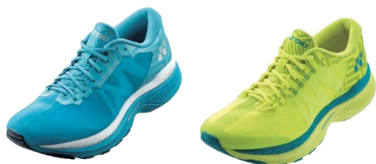
「セーフラン 100L」左からアクアブルー、 アシッドイエロー