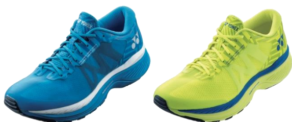
「セーフラン 100M」左からコバルトブルー、 アシッドイエロー