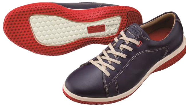
「パワークッション107」（ネイビーブルー）

ヨネックス株式会社（代表取締役社長：林田 草樹）は、ウォーキングシューズの最大の機能である衝撃吸収性と反発力を併せ持ち、さらに進化した「パワークッションプラス」を搭載し、デザイン性と快適な履き心地を両立した男女兼用のウォーキングシューズ「パワークッション107」を2019年9月中旬より発売いたします。