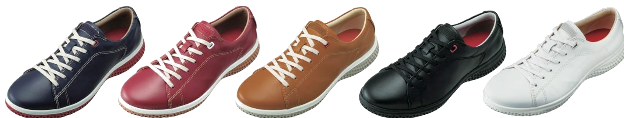
「パワークッション 107」左からネイビーブルー、レッド、ライトブラウン、ブラック、ホワイト