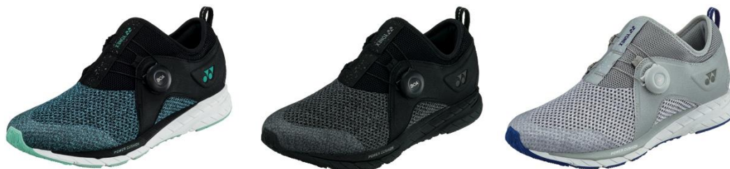
「セーフラン 350L」左からブラック/ミント、ブラック、ライトグレー