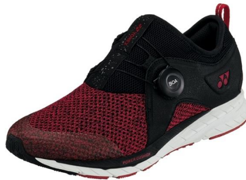
「セーフラン 350M」(ブラック/レッド)

12mの高さから落とした生卵が、割れずに6m以上跳ね返る「パワークッション®プラス」搭載 Boa®フィットシステム※1が足アーチを快適サポート セーフラン 350M(男性用)・350L(女性用) 2019年3月下旬より発売