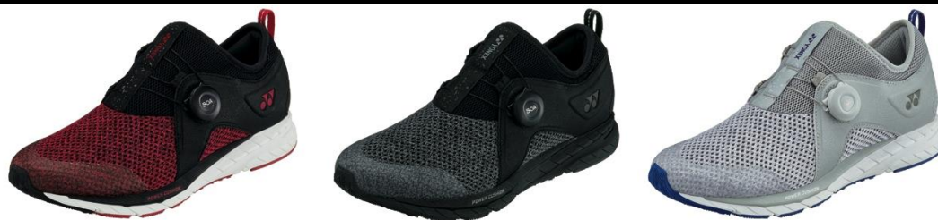
「セーフラン 350M」左からブラック/レッド、ブラック、ライトグレー