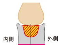
外側へ張り出した設計