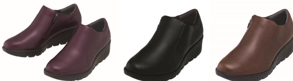
「パワークッション LC101」左からバーガンディー、ブラック、ブラウン