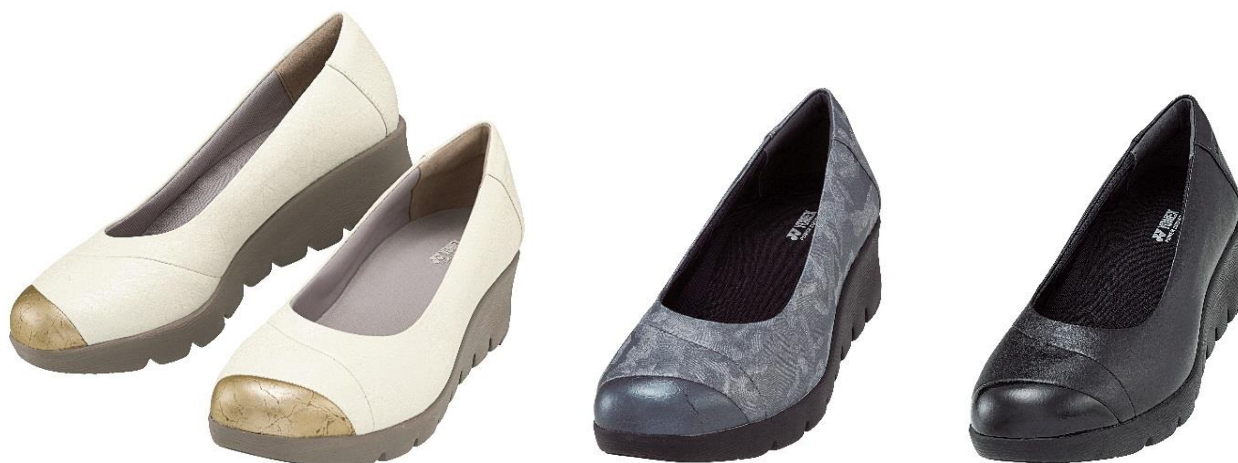
パワークッション LC97 左からオフホワイト、パールチャコール、ブラック