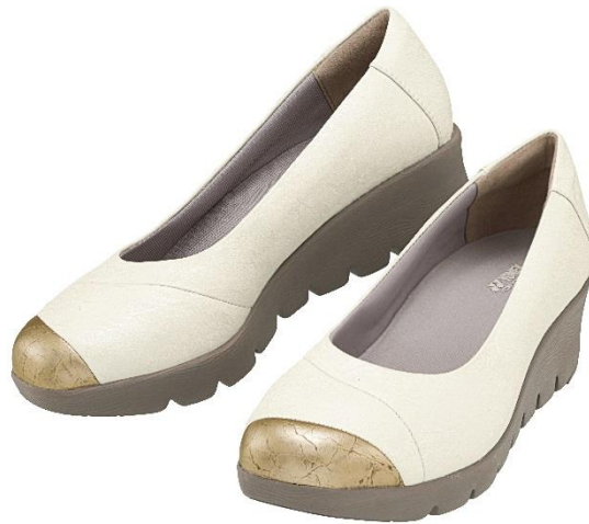
イメージキャラクターの高島礼子と弾む軽ふわカジュアルパンプスのLC97

ヨネックス株式会社（代表取締役社長：林田 草樹）は、ウォーキングシューズの最大の機能である衝撃吸収性と反発力を併せ持つ素材パワークッションに加え、さらに進化させた「パワークッションプラス」も搭載し、厚底設計なのに軽いカジュアルパンプスのLC97を2018年6月上旬より発売致します。