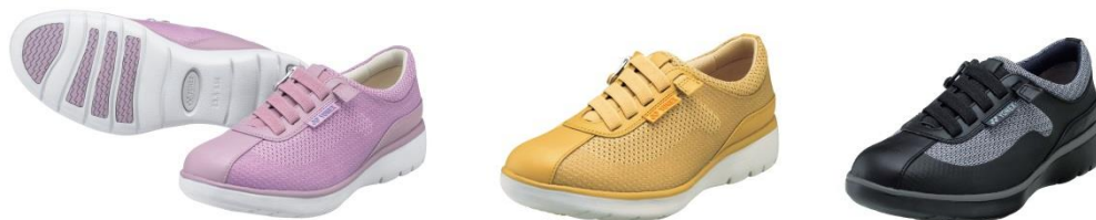
女性用パワークッション LC94 左からライラック、マスタード、ブラック