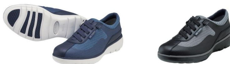
男性用パワークッション MC94 左からネイビーブルー、ブラック