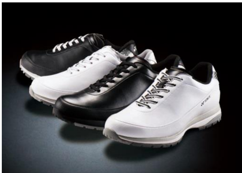
新たに「パワークッションプラス」を搭載した SHG-705 シリーズ

ヨネックス株式会社（代表取締役社長：林田 草樹）は、衝撃吸収性と反発性を併せ持つ素材パワークッション®をさらに進化させた「パワークッションプラス」を新たに搭載し、左右非対称ソール（新アシンメトリーパワーグリップ・スパイクレスソール）によりグリップ力が高まりスウィング時の安定性向上を狙ったスパイクレスゴルフシューズの新製品を2017年10月中旬より発売致します。