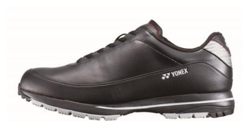
男性用パワー Cushion 705 左からホワイト、ブラック