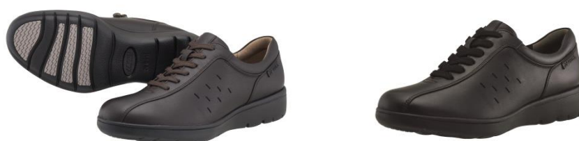
男性用パワー Cushion MC92 左からダークブラウン、ブラック