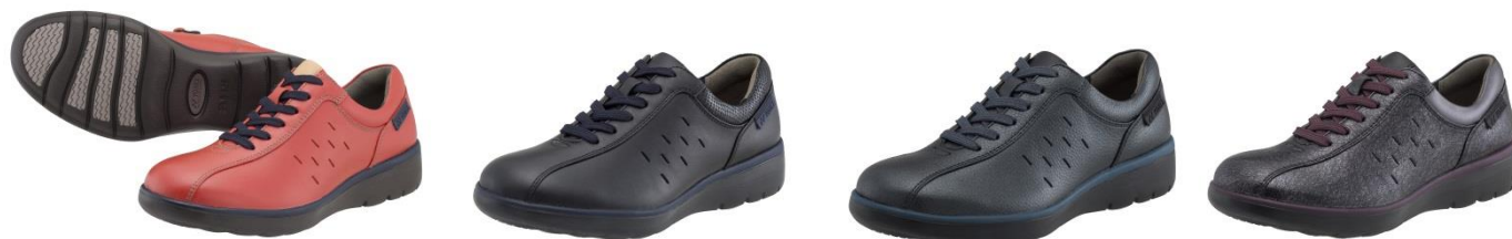
女性用パワー Cushion LC92