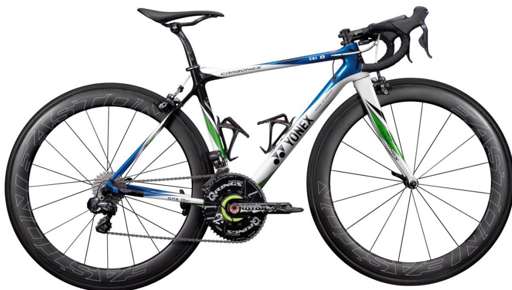
カーボンバイクフレーム CBXFS03 の新デザイン【ブルー×グリーン】