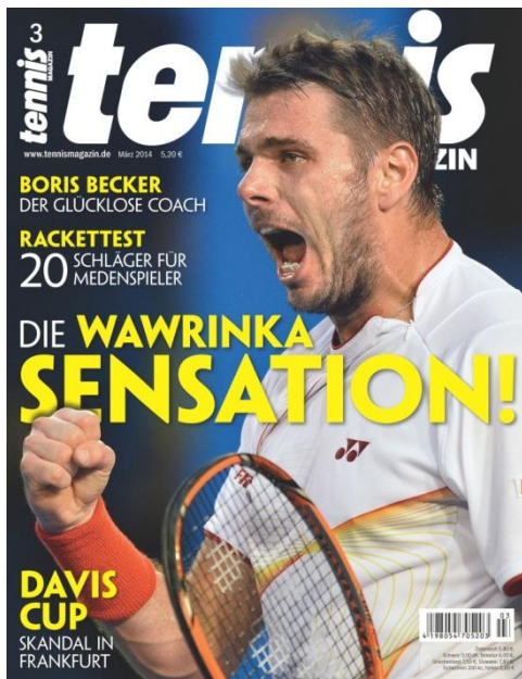
ドイツのテニス専門誌『テニスマガジン』