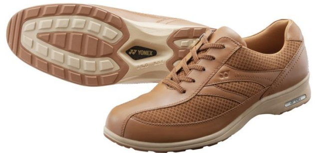
(上)パワークッション LC65(ピンク) (下)パワークッション MC65(キャメル)

(左)7mの高さから生卵を落としても割れずに4m以上跳ね返す衝撃吸収力・反発力を併せ持つ素材「パワークッション」