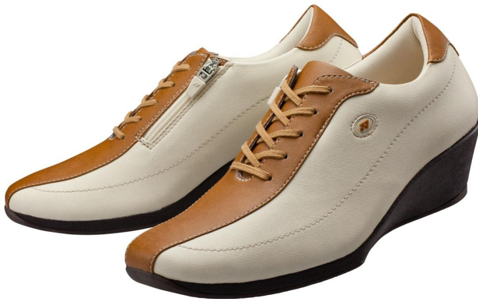
パワークッション カジュアルウォーク LC59(カラー:ブラウン/ベージュ)