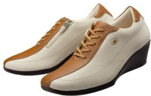
ブラウン/ベージュ