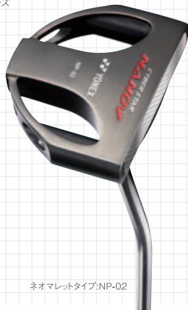
ネオマレットタイプ:NP-02