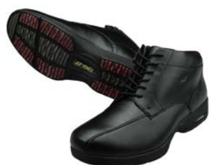
MC51 (男性用) ブラック