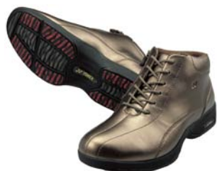
LC51 (女性用) パールゴールド