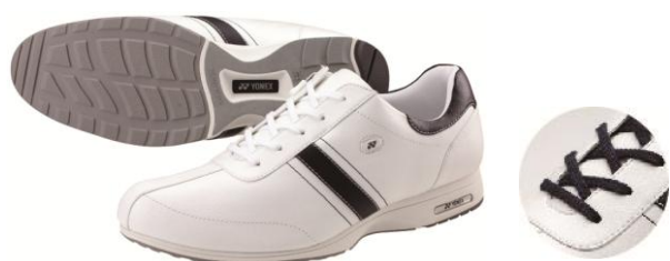
MC60(男性用) ホワイト/ネイビー