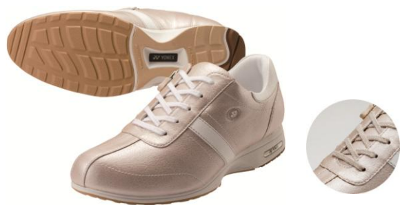
LC60(女性用) パールベージュ