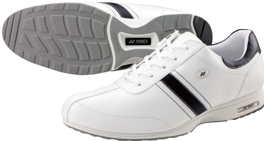
パワークッション カジュアルウォーク MC60(カラー:ホワイト/ネイビー)