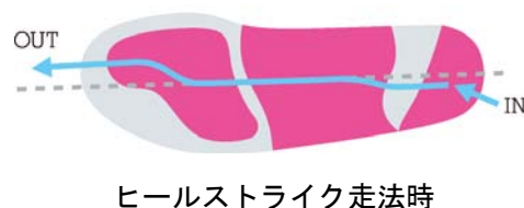
ヒールストライク走法時