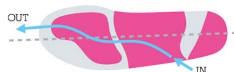
ミッドフットストライク走法時