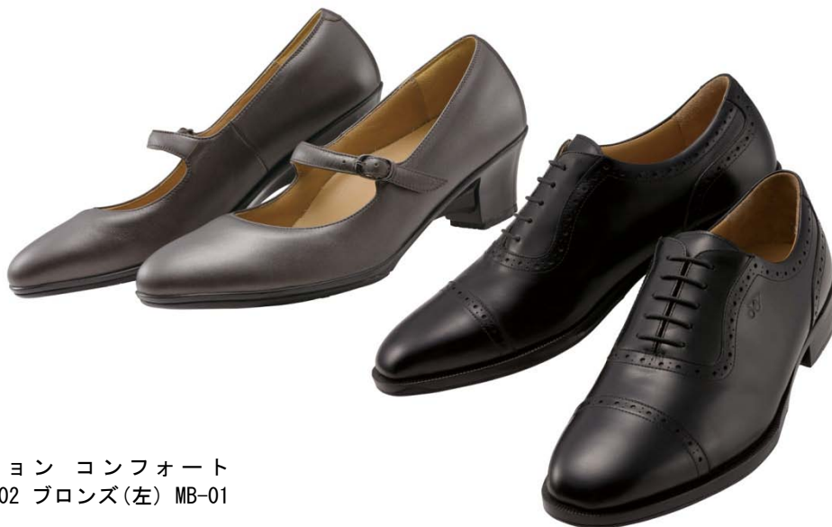
パワークッション コンフォート Be-COMFORT LB-02 ブロンズ(左) MB-01 ブラック(右)