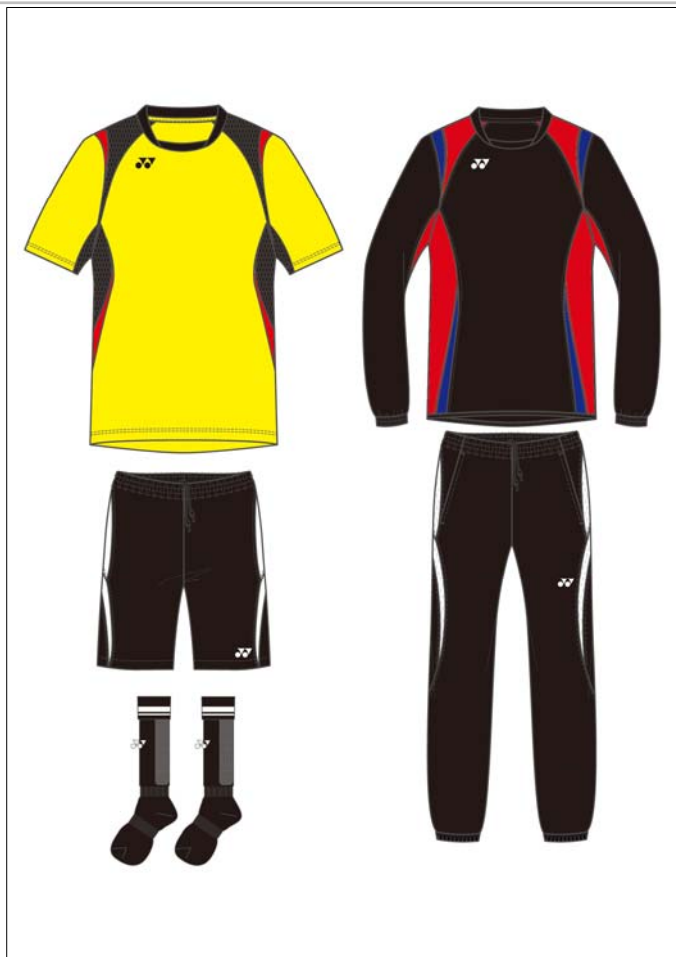
ヨネックスのフットボールウェア（右上新から時計まわりに） トレーニングトップ、トレーニングトップ パンツ、 ゲームソックス、ゲームパンツ、ゲームシャツ

ヨネックス株式会社（代表取締役社長：米山勉）は、サッカー、フットサル用のフットボールウェアを4月より発売し、サッカーウェア事業へ参入いたします。