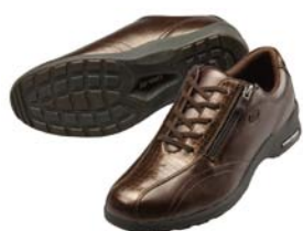
クロコダイルブラウン