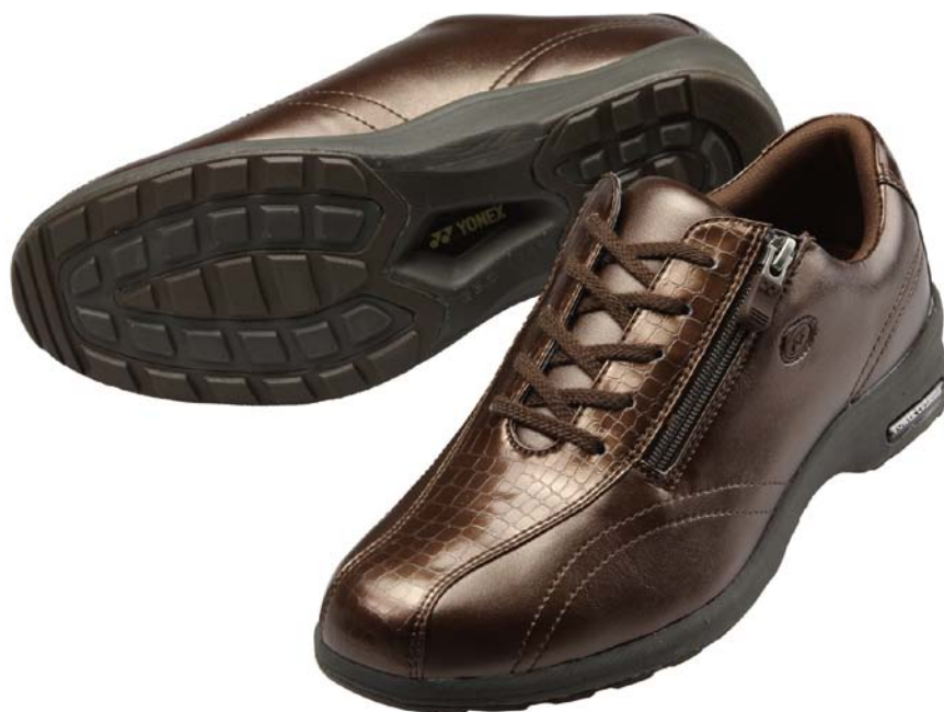
パワークッション カジュアルウォーク女性用 LC30 クロコダイルブラウン