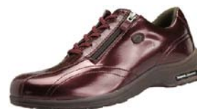
クロコダイルボルドー