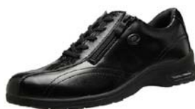
クロコダイルブラック