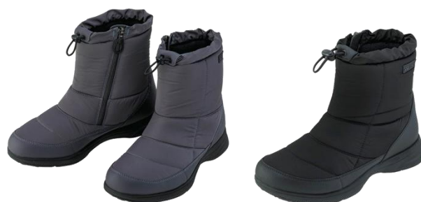
「パワークッション110」左からチャコール、ブラック