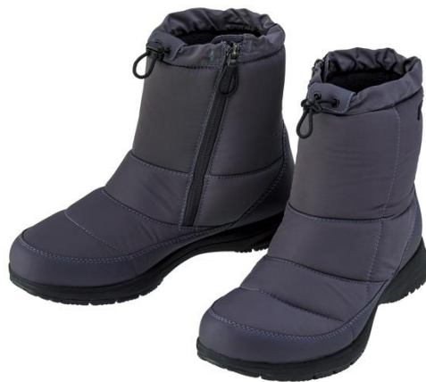
「パワークッション110」(チャコール)

ヨネックス株式会社(代表取締役社長:林田 草樹)は、ウォーキングシューズの最大の機能である衝撃吸収性と反発力を併せ持ち、さらに進化した「パワークッションプラス」を搭載し、凍結路面でも滑りにくい男女兼用のブーツ「パワークッション110」を2019年10月中旬より発売いたします。