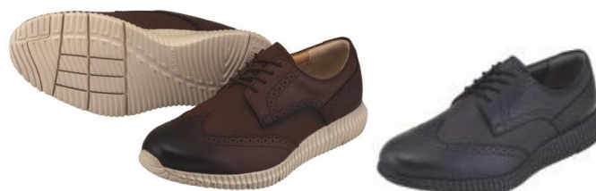
男性用「パワークッション MC105」左からダークブラウン、ブラック