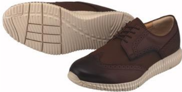
男性用「MC105」(ダークブラウン)

ヨネックス株式会社(代表取締役社長:林田 草樹)は、ウォーキングシューズの最大の機能である衝撃吸収性と反発力を併せ持つ素材「パワークッションプラス」を搭載し、ビジネス、カジュアルの両シーンで履けるウォーキングシューズ「LC105」「MC105」を2019年3月中旬より発売いたします。