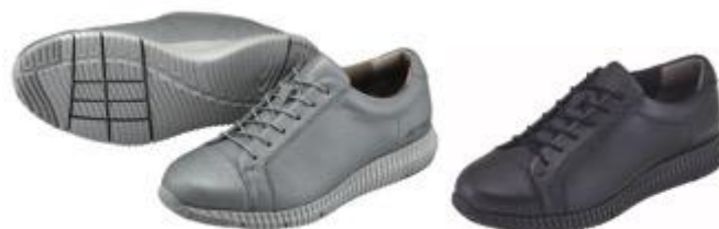
女性用「パワークッション LC105」左からシルバー、ブラック