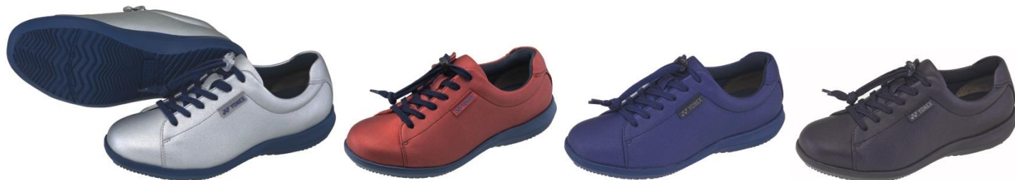
女性用「パワークッション LC104」左からシルバー、パールレッド、パールネイビー、ブラック