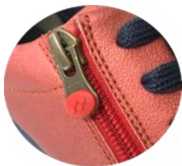
【オートロックファスナー】

アッパー内側にオートロックファスナーを付属し、着脱簡単。 靴紐はコードロック付きで、紐を結ばずに着圧調整できます。 簡単操作で快適なウォーキングをお楽しみいただけます。