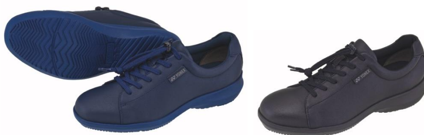
男性用「パワークッション MC104」左からネイビーブルー、ブラック