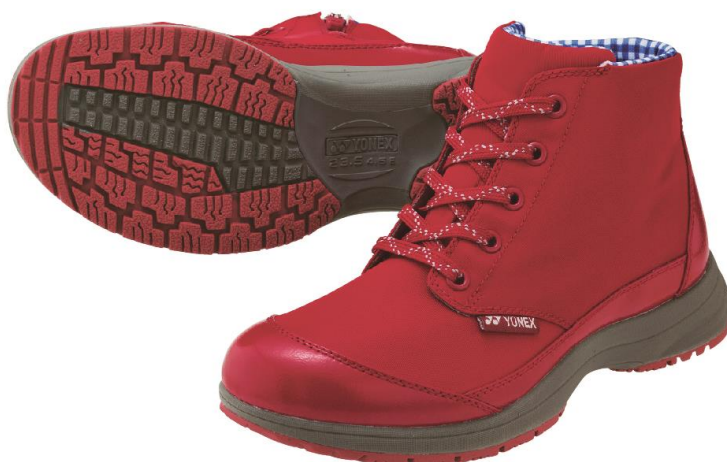
全天候対応、ゆったり快適ブーツのLC93

ヨネックス株式会社（代表取締役社長：林田 草樹）は、ウォーキングシューズの最大の機能である衝撃吸収性と反発力を併せ持つ素材「パワークッション®」搭載に加え、防水性もプラスし、季節・天候を問わず一年を通して“ゆったり”履けるブーツ LC93・MC93 を2017年9月上旬より発売致します。