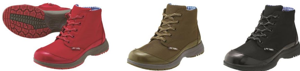
女性用パワークッション LC93 左からレッド、オリーブ、ブラック