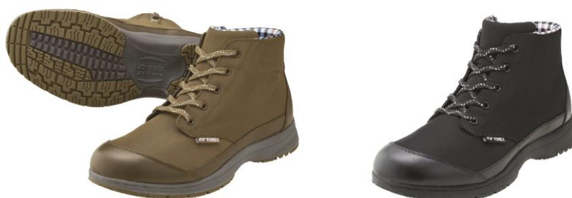
男性用パワークッション MC93 左からオリーブ、ブラック