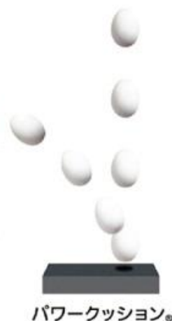
パワークッション®

※それぞれ軟質ウレタン素材との比較値。※トレーニング科学研究所の実験データによる。※すべてのヨネックスウォーキングシューズ(インソール及びミッドソール)に採用。