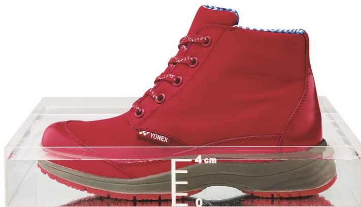
※地面から深さ4cmの浸状態での防水機能。完全防水ではありません。