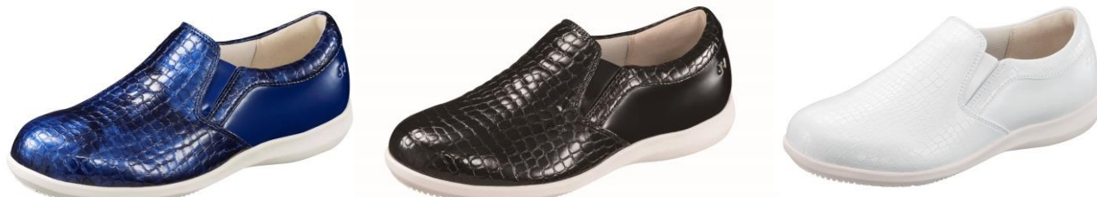
女性用パワークッション LC91