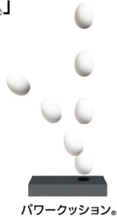
パワークッション®

※それぞれ軟質ウレタン素材との比較値。※トレーニング科学研究所の実験データによる。※すべてのヨネックスウォーキングシューズ(インソール及びミッドソール)に採用。