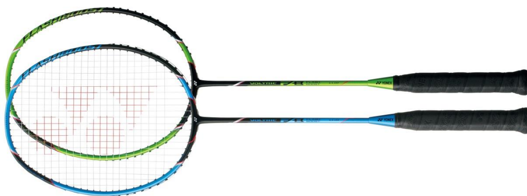
VOLTRIC FB (上) ブラック/グリーン (下) ブラック/ブルー

ヨネックス株式会社(代表取締役社長:林田 草樹)は2017年2月上旬にバドミントンラケット「VOLTRIC FB(ボルトリック エフビー)」を世界同時発売いたします。 VOLTRIC FBは一般的なバドミントンラケットよりもとても軽量(平均73g)*でありながら、独自の設計と当社バドミントンラケットに初めて採用した素材で、パワーと打ち応えを求めるお客様にもご満足いただける性能を併せ持っています。 “FB”とは軽量化によるスウィングスピードの向上と自在な操作性、ならびにボルトリックシリーズのパワーを象徴する「Flash Boost」の略称です。