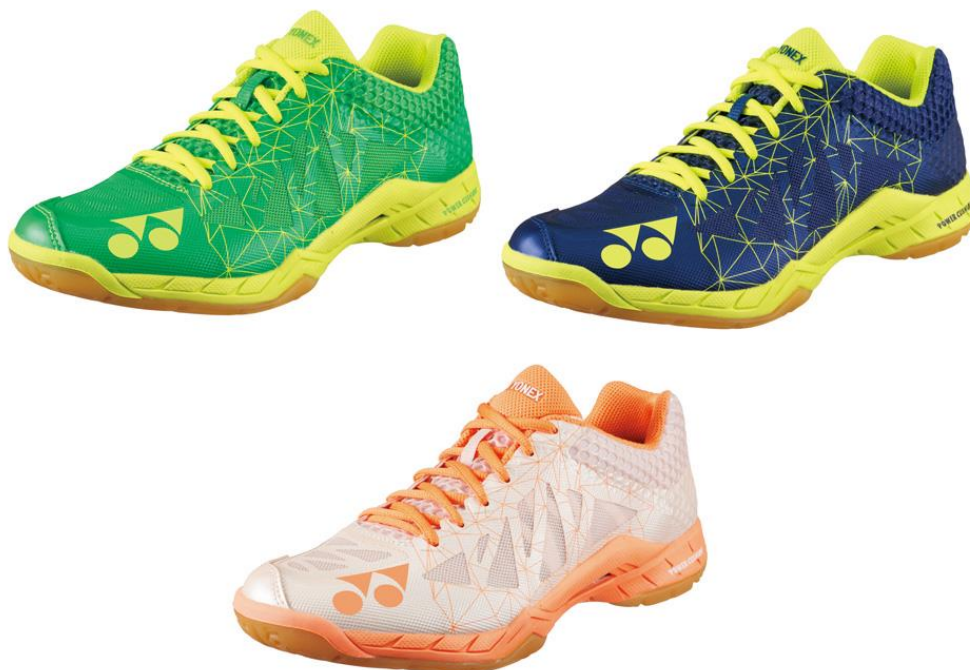
(画像上段左から) パワークッション エアラス2 メンのグリーン、ネイビーブルー (画像下段) パワークッション エアラス2 レディースのパールオレンジ

ヨネックス株式会社（代表取締役社長：林田草樹）は、新素材「タフガードIV」と「デュラブルスキンライト」を配した当社史上最軽量バドミントンシューズ「POWER CUSHION AERUS2（パワークッション エアラス2）」を2016年10月下旬より発売いたします。