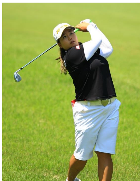
▲アン ソンジュプロは2016年シーズン5月より実戦にて使用中。

○商品画像のダウンロードはこちらからできます>> http://urx.blue/tZLh