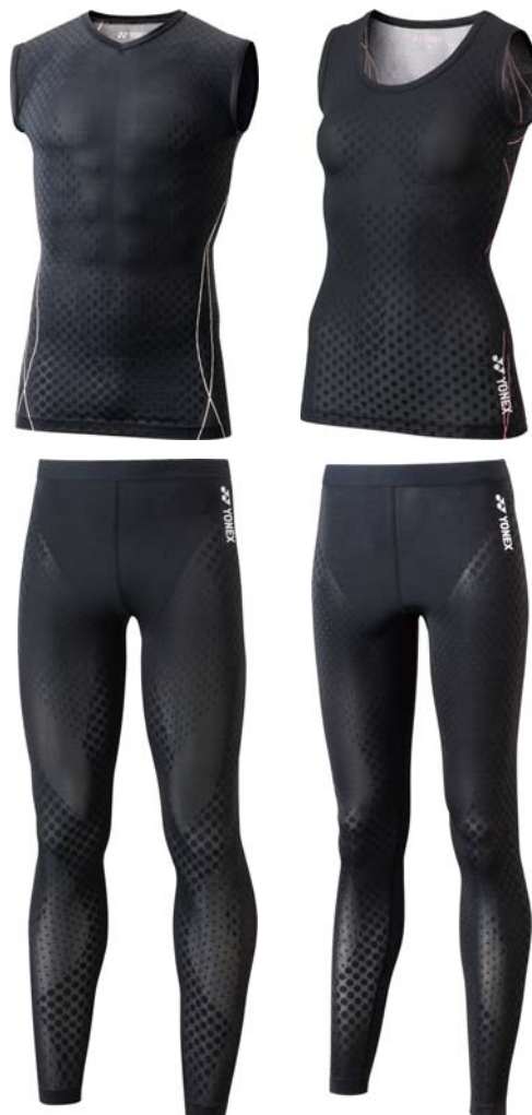
←高機能アンダーウェア STB プロモデルのノース リーブシャツ UNI (左 上)、ロングスパッツ UNI (左下)、タンクトップ WOMEN (右上)、ロング スパッツ WOMEN (右下)