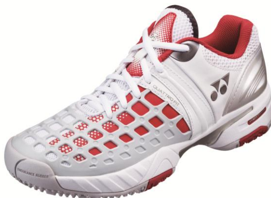
「パワークッション17メン」

アメリカテニス専門誌「テニスマガジン（5 - 6月号）」が、世界の新品テニスシューズを対象に開催した2014年シューズガイド企画において、全豪オープン優勝で弊社アドバイザースタッフのスタニスラス・ワウリンカ選手(スイス)などトッププロが使用するヨネックステニスシューズ『パワークッション17メン』が最優秀オールラウンドシューズに選ばれました。