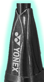
E. B. CAP PLUS

シャフト部には弾きと振り抜きを両立する「SUPER SLIM SHAFT」を採用。剣先キャップ「E. B. CAP PLUS」は、シャフトのしなりを高め、ラケットへのパワー伝達を高めめます。