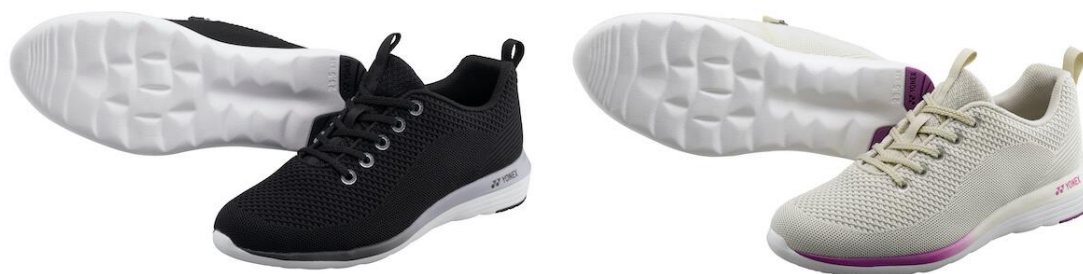
左からブラック、オフホワイト