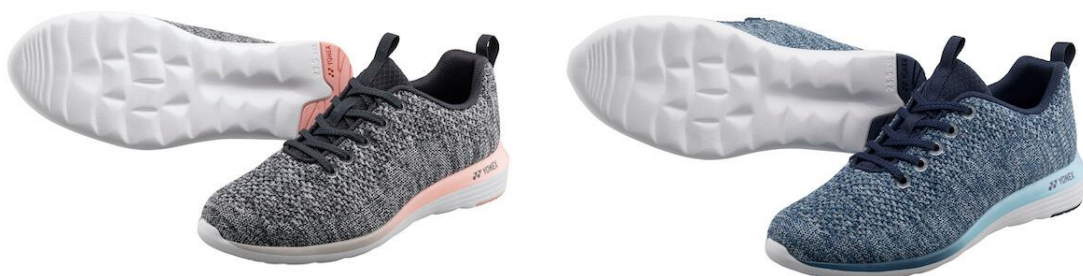
左からグレー、ブルー