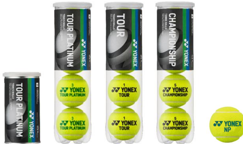
左から、TOUR PLATINUM（2球入り缶）、同（4球入りペットボトル）、TOUR、CHAMPIONSHIP、NP

ヨネックス株式会社（代表取締役社長：林田 草樹）は、テニス事業全体の強化の一環としてテニスボールの販売に力を入れるべく、国際テニス連盟（以下、ITF）公認球3機種「TOUR PLATINUM（ツアープラチナム）」、「TOUR（ツアー）」、「CHAMPIONSHIP（チャンピオンシップ）」および練習・レジャー用ボール「NP（エヌピー）」を2021年1月下旬より全国の大型量販店やスポーツ用品店等で発売いたします。