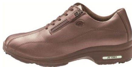
L21HS(女性用)スモークピンク