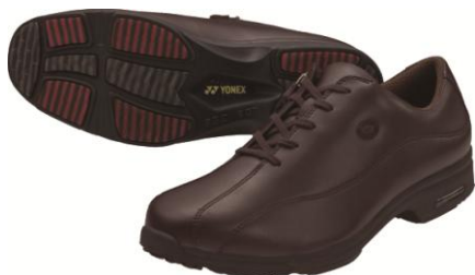
M21HS(男性用)ダークブラウン