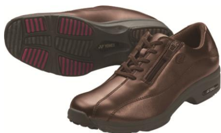
L21HS(女性用)パールブラウン