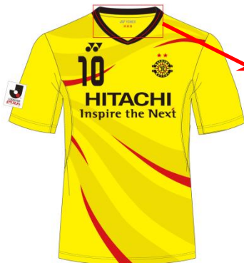
〈ゲームシャツ正面〉

シャツもパンツも、チームカラーのレイソルイエローをベースにコロナレッドを配しており、それはまさに、燃えさかる太陽のコロナを身にまとい降臨した太陽王の姿そのもの。地上に降り立った太陽王の力を受け、勇敢に出陣するレイソル戦士をイメージしました。