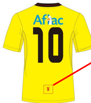
〈ゲームシャツ背面〉