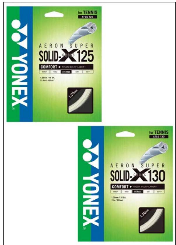
新発売となるエアロンスーパー ソリッドクロス 125（上）、130（下）のパッケージ

ナイロンマルチストリングは、柔らかい打球感が特徴ですが、新製品ストリングではナイロンマルチを主構造としながら、打ちごたえと高い反発性が特徴のナイロンモノを組み合わせました。これにより、今までにない柔らかさと打ちごたえを併せ持ったナイロンマルチストリングとなりました。